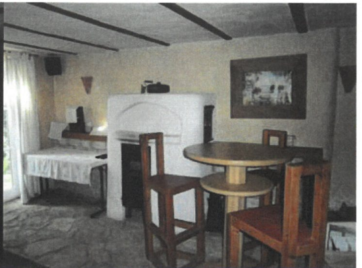
Wohnraum mit Kamin